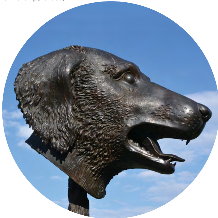
Ai Weiwei, Circle of Animals/Zodiac Heads , 2011.